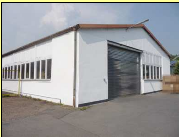
Vorderansicht / Zufahrtstor