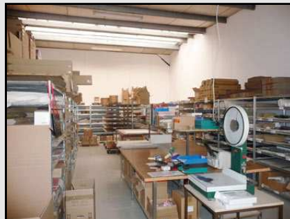
Teilansicht der Halle