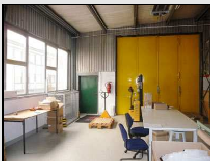
Blick zum Tor